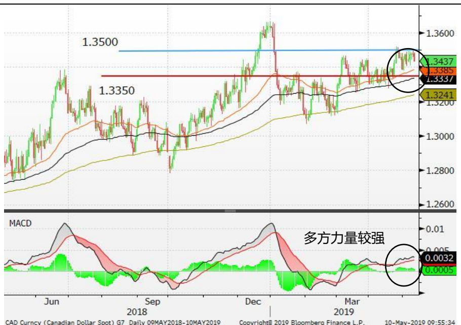
图 6: 美元/加元 - 日线图: 美元/加元反覆上试 1.3500 的阻力位。多方力量较强, 这料为美元/加元提供支持。短期内, 美元/加元或继续上试 1.35 的阻力位。