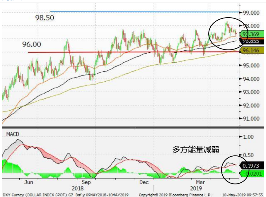
图 2: 美元指数-日线图: 美元指数在 97.50 附近好淡争持。多方能量减弱, 美元指数的上行动力或受到限制。短期内, 美元指数将继续在 96-98.50 内区间波动。