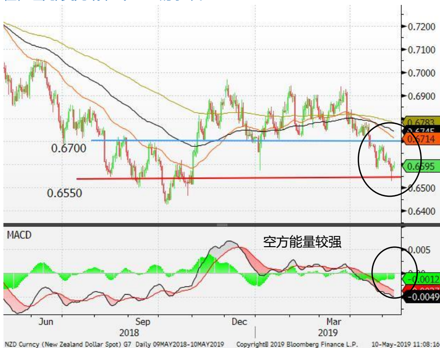
图 1: 纽元/美元 - 日线图: 纽元/美元下挫并一度失守 0.6550 的支持位。空方力量较强，纽元进一步走低的可能性不可排除。若失守 0.6550 的支持位，纽元/美元或下试 0.65 的水平。