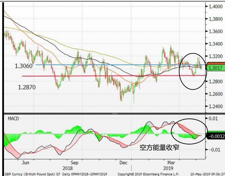
图 4: 英镑/美元-日线图: 英镑/美元一度突破 1.3060 的阻力位, 惟未能企稳, 并反覆回落至 100 天移动平均线 (黄绿) 附近。空方力量进一步收窄, 或有助减轻英镑的下行压力。关注英镑/美元能否突破并企稳 1.3060。