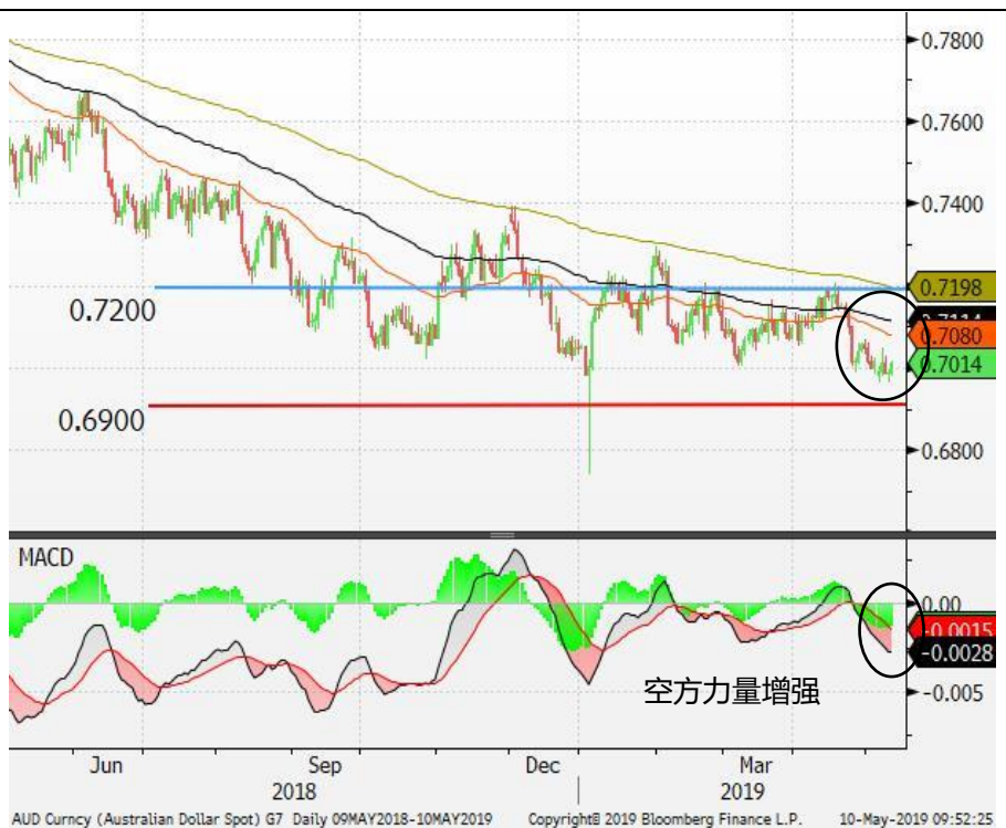
图 7: 澳元/美元 - 日线图: 澳元/美元在 0.7 的附近好淡争持。空方力量增强, 澳元或继续承压。若未能企稳 0.7 的支持位, 澳元/美元料进一步反覆走低。