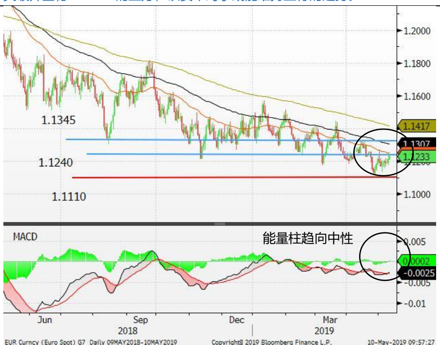
图 3: 欧元/美元-日线图: 欧元/美元继续在 1.1190 附近好淡争持。能量柱趋向中性, 意味着欧元可能继续维持双向波动的走势。短期内, 若欧元/美元突破并企稳 1.1240 的上方, 该货币对子或能维持上行的走势。